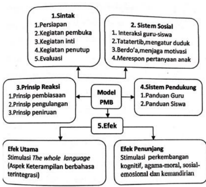
Gambar 2. Hasil pengembangan model BTPB

Struktur model BTPB terdiri dari langkah pembelajaran (sintak) system sosial, prinsip reaksi, system pendukung dan efek model BTPB (gambar 2). Hal ini sesuai dengan penjelasan (Nieveen, 2009) (Bachri, 2005) bahwa suatu produk dikatakan valid jika intervensi/ perlakuan yang diberikan memenuhi kebutuhan dan komponennya berdasarkan pengetahuan mutakhir dan semua komponen saling terkait.